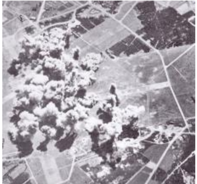
Figuur 6 Bombardement op Amersfoort

Maar die vrijdag de 13de was het wel heel erg dichtbij, de vliegtuigen scheerden vlak over ons huis, we hoorden de bommen gierend over ons heen gaan, daarna zware explosies waar het hele huis van schudde, de ruiten vlogen allemaal aan scherven door het hele huis en wat los stond op schoorsteen en planken lag overal verspreid. Ik weet nog dat de meeste mensen in huis al in de kelder