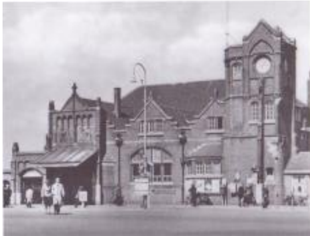
Figuur 1 Het oude station van Amersfoort

Jammer genoeg wisten ze niet dat aan de overkant wel hulp nodig was. Daar was de vrouw van meester Keizer bevallen, meester Keizer was als groepsleider van de Bescherming Bevolking niet thuis en het nonnetje dat bij mevrouw Keizer zat op te passen liet wel ijverig de rozenkrans schuiven maar verzuimde de kraamvrouw te verzorgen. Mevrouw Keizer is aan de gevolgen daarvan overleden.