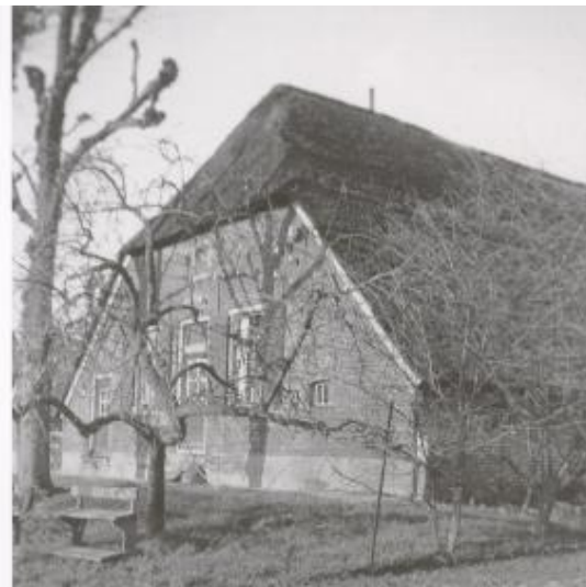
Figuur 7 Boerderij "Den Akker"

De volgende gebeurtenis die ik me nog goed herinner was dat we op een kwade dag werden gewaarschuwd dat er weer een razzia was en dat de Landwacht overal op Hoogland binnen viel op zoek naar onderduikers. De mannen moesten dus weer op de vlucht, voor de veiligheid ging ik op de fiets voor hen uit en keek onderweg steeds goed of er ergens onraad was. Zo zijn we helemaal de Nieuwlandseweg afgelopen, overgestoken naar de Zeldertseweg en aan het eind ervan naar de Eem. Midden in de Eempolder waren nog door de Hol-